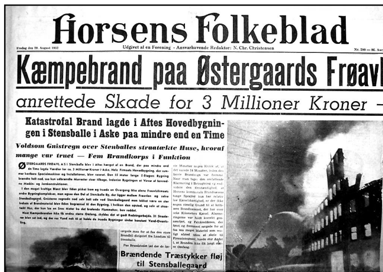
Horsens Folkeblad den 29. august 1952.

Fredag den 29. august 1952 var forsiden af Horsens Folkeblad ryddet for at fortælle: Kæmpebrand på Østergaards Frøavl – skade for 3 millioner kroner – hovedbygning lagt i aske på mindre end 1 time.