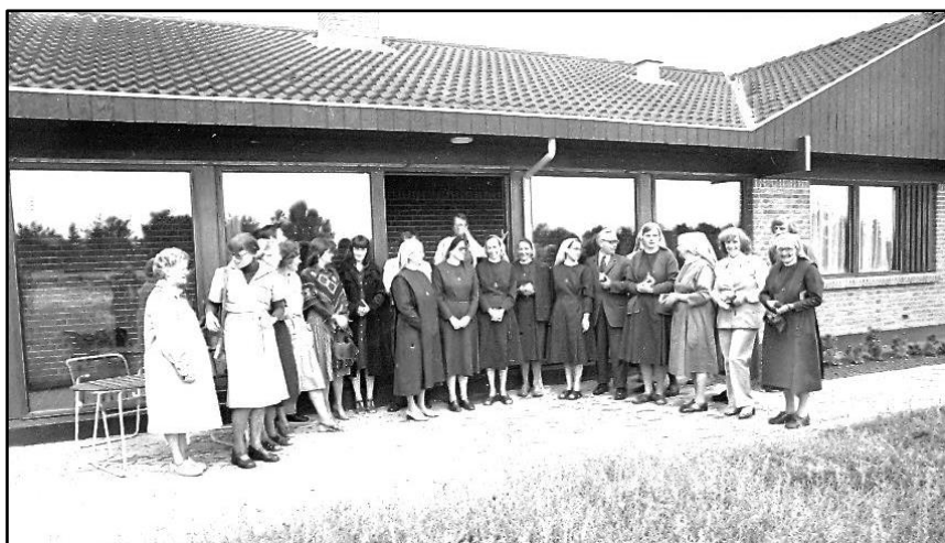
Assumptionssøstrene linet op til fotografering på Sundbakken 16.

Klosterets fraflytning skyldes udelukkende, at Horsens Kommune ændrede på områdets lokalplan fra svag til fuld udbygning med såvel lave som høje huse, herunder 3. etages ejendomme. Dette umuliggjorde klosterets arbejde, der fordrede stilhed og ro. Klosteret valgte derfor at flytte til Kiltning på Als ved Sønderborg. I dag har Bakkeskolen overtaget klosterets bygninger.