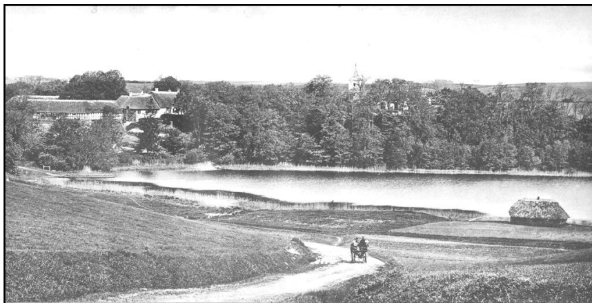
Vær præstegård og Vær sø, 1914.

Endvidere nævnes, at for vin og brød nyder præsten af Stensballegaard efter gl. skik 2 td. Rug, 8 td. Byg og 2 td. Havre. Fri ildebrand og olden har præsten ingen rettighed til, men det beror på kirkepatronens godhed, hvad ham kan forundes.