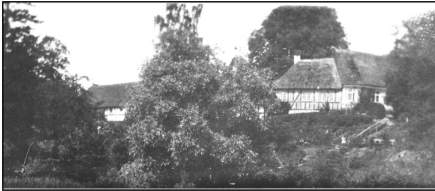
Vær præstegård set fra søsiden, 1914. Køkkenhaven ses til højre.