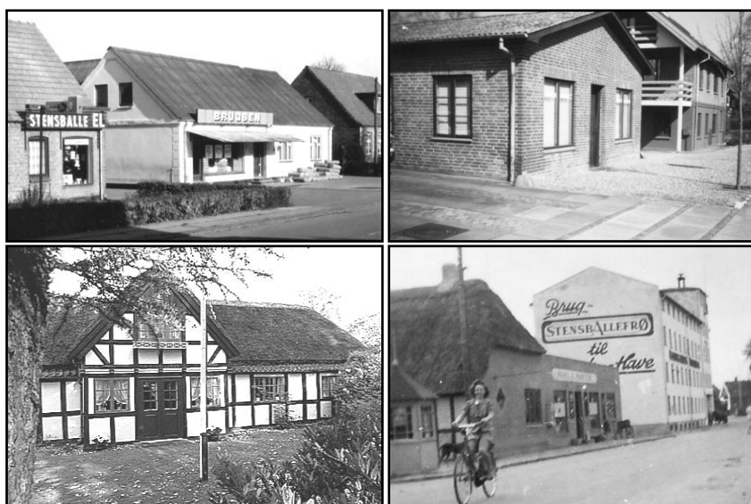
Øverst. Stensballe El, Brugsen og Smedien. Nederst. Kommunekontoret, Købmanden og Østergaards Frøavl.