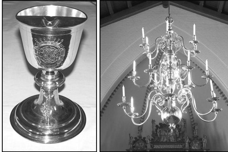
Alterkalk med graveringer og relief. Foto 2015 Den smukke lysekroner belyst af den lavtstående vintersol. Foto 2015

Dåbsfadet er ét af de messingfade, der findes i mange danske kirker, af hvilke de fleste er fremstillet i Nürnberg omkring 1550-1575. Dets indgravninger viser, at det er skænket til Nebel kirke i 1650 af ægteparret Henric Mund og Berete Mormand.