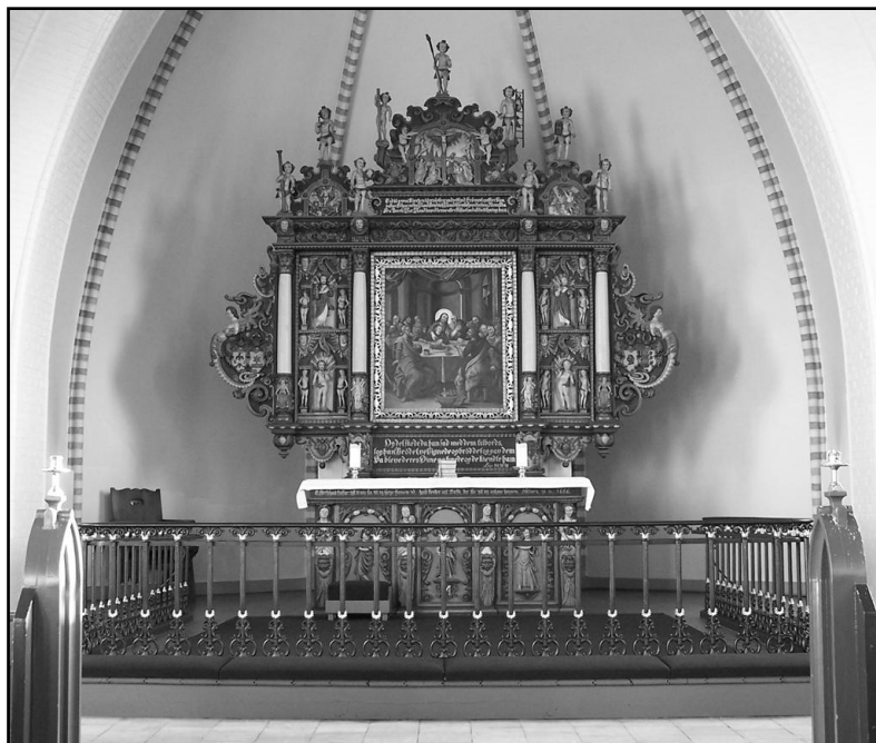
Altartavle og alterbord. Foto 2015

Folkebladet fortæller videre (stolt), at kirken med sit anselige tårn præsenterer sig smukt i landskabet og gør et indtryk, der adskiller kirken højt fra vore almindelige hvidkalkede landsbykirker. Tillige bærer den ved sine tykke mure og stræbepiller en soliditet, der tyder på, at der ikke er sparet på noget. Tårnet med spir har en højde af 80 fod (24,8 m), deri er ikke medregnet korset, der pryder spiret. Mod øst har kirken en 20 fod (6,2 m) bred apsis. Hele kirkens længde er 100 fod (31 m), medens bredden er 32 fod (9,9 m). Højden fra det flisebelagte gulv til loftet er 27 fod (8,4 m). De indvendige mure er ikke som sædvanligt optrukne med kalkpuds, men malet i rød limfarve, og de anvendte forsiringssten fremtræder i naturlige grå og gule farver, således at de gule sten danner gesims, fodstykke og søjle.