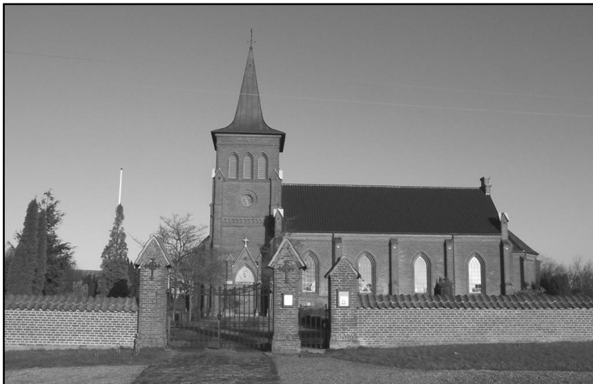
Serridslev kirke. Foto 2015