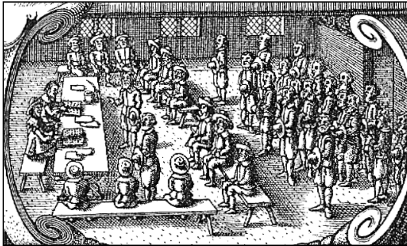
En herreds- eller birkeret

Chr. IV nyordnede i 1623 reglerne for birkeretterne, og med Danske Lov gennemførtes i 1683 fælles retsgrundlag for birker og herreder, og der blev tildelt birkeret til adskillige adelsfamilier på landets godser som et privilegium. Det tilkom nu grever og baroner at lade deres undergivne, d.v.s. tjenestefolk, fæstebønder, daglejere, håndværkere m.fl., dømme på eget birketing, ligesom deres ret til selv at retsforfølge og eksekvere liv- og legemsstraffe - hals og håndsret - blev præciseret.