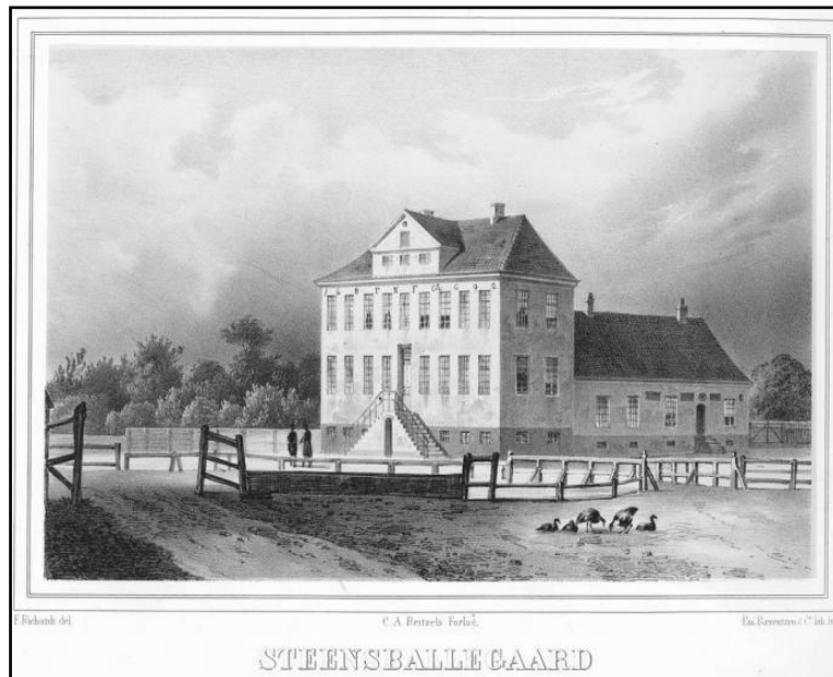
Ferdinand Richardts tegning fra o.1845