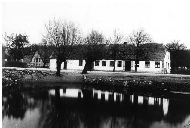
Den gamle skole i Stensballe lå ved indkørslen til Stensballegård. Ophørte med at være skole i 1907, og blev nedbrudt 1925 - 30