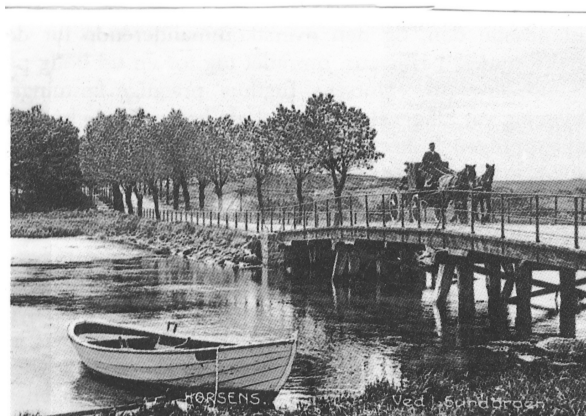
Den første vejbro over Sundet.

Baronen havde rejst sagen, fordi han i 1695 havde købt øen Endelave og ønskede at føre sine landbrugsprodukter til havnen i Horsens (lidt kajplads udfor Havneallé, der frøs til om vinteren) uden at skulle betale havneafgift. Skulle baronen betale afgift, så skulle Horsens Købstad også betale afgift for oplægning af skibe i den isfri vinterhavn ved Sundet. Sagen var kompliceret: Er vandet i Sundet hav-, fersk- eller brakvand?. Der fandtes særlig lovgivning for salt- og ferskvand, men blandet vand skaber forvirring.