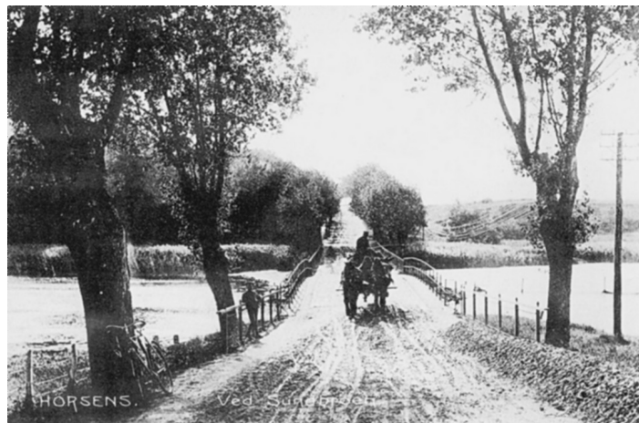
Sundbroen set fra Horsens-siden, ca 1910.

fra Vær sogn” med leverancer til byerne Århus, Viborg, Silkeborg, Vejle og Horsens. Bønderne ville give lav pris for frikøb, medens Stensballegård krævede høj pris for ulemperne ved mindsket areal og mistet arbejdskraft. Det betød, at der måtte officiel mægling til, før en ordning kunne etableres.