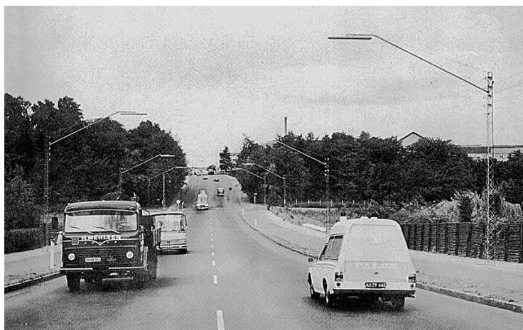
Sundbroen set fra Stensballe-siden, ca. 1976