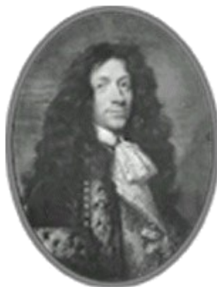
Peder Griffenfeld på højden af sin magt. Maleri på Frederiksborgmuseet.

dobbelt-diplomati og landsforrædervirksomhed ofte forveksles (ministerrokade) ” og havde man hørt efter Griffenfeld, så havde Danmarks forløb med hensyn til Skåne, Slesvig og Holsten fået et andet forløb”. Anklagen for modtagelse af bestikkelse var korrekt.