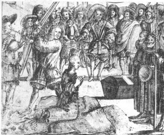
Griffenfelds ” henrettelse” i 1676. Gl. kobberstik.

Billedet viser Griffenfelds »henrettelse« i det øjeblik, da benådningen bliver udråbt (af manden til venstre). Foran den knælende synder står præsterne, som har beredt ham til døden. I baggrunden venter kisten. - Anonymt, men vistnok samtidigt stik, her vist beskåret.