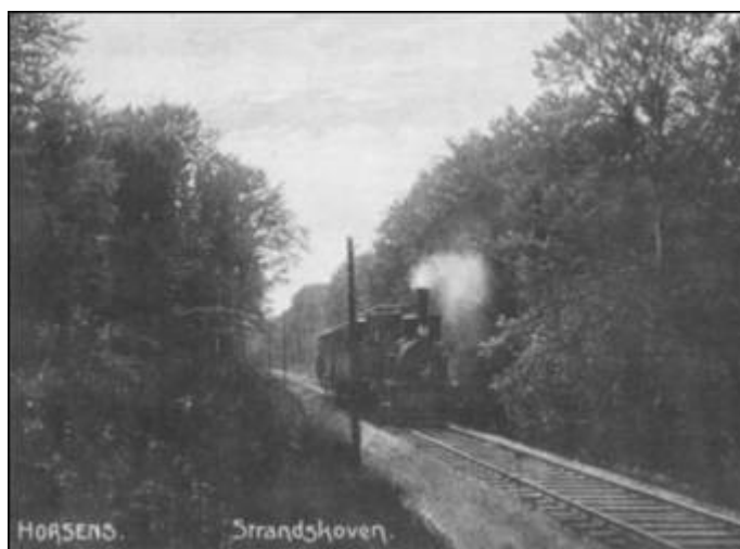
Det første togmateriel på Odderbanen, omkring 1905.

Efter 1967 køres strækningen med busser, men ruten er en ganske anden end i banernes tid.