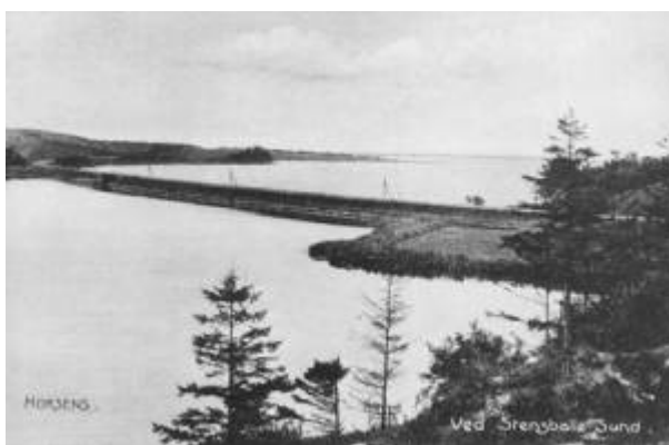
Jernbanebroen over Stensballe Sund 1904