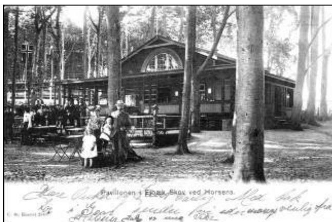
Pavillonen" i Ellbækskov, ca. 1905..