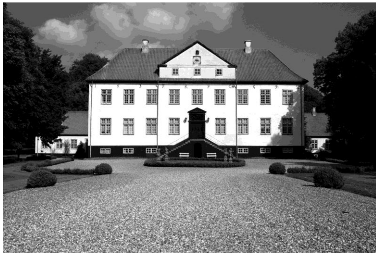
Stensballegaard, 2000.