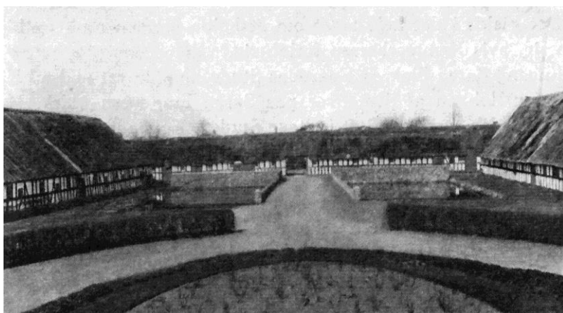
Den nedrevne stråtede bindingsværksladegård, bygget 1694.