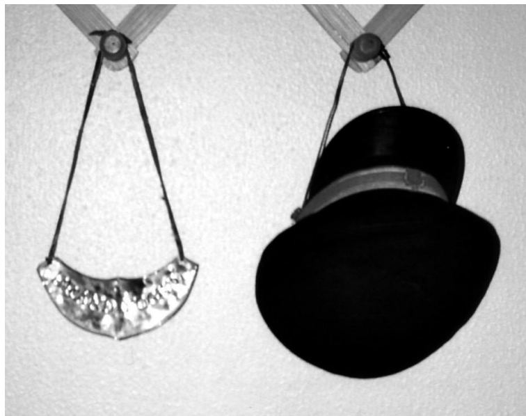
Brandfogedens kasket og skilt. Foto 2004.

Til alle øvelser og brande var der mødepligt, og i de fleste blev der noteret ”fuldt mandskab”. Ikke-mødte blev noteret og grunden dertil angivet.