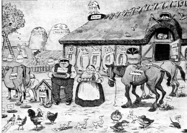
Socialdemokratiet har ikke altid forstået landbrugets problemer. ”Det betrængte Landbrug”, Blæksprutten i 1916.

efterfølgende generalforsamling. – I 1969 var der møde om kommunesammenlægningen med Horsens. Foreningens kandidat til byrådet blev nr. 15 på Socialdemokratiets liste. Placeringen beroede på de lokale foreningers medlemstal i Horsens, Vær, Hatting, Tyrsted og Bækkelund.