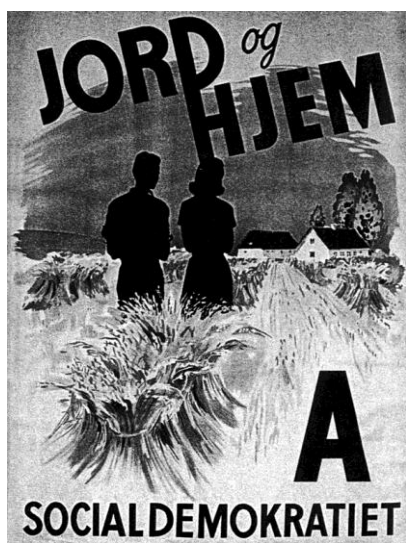
Valgplakat fra først i 1900-tallet