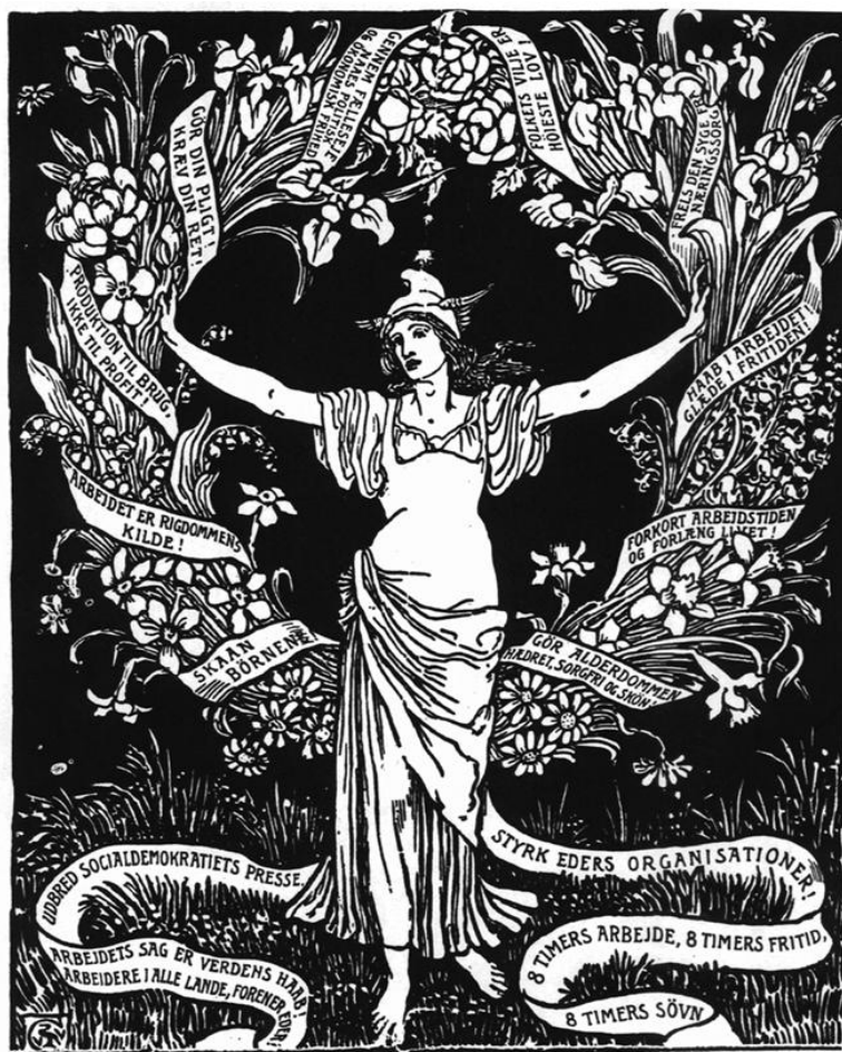
Den socialdemokratiske drøm i slutningen af 1800-tallet

Foreningen "Vær Sogns Socialdemokratiske Forening" blev oprettet i 1906 med det formål: "At udbrede kendskabet til Socialdemokratiet og søge politisk indflydelse ved indvalg af repræsentanter til sognerådet". Fra 1910 blev man repræsenteret i sognerådet og fik dermed indflydelse, men aldrig magten. Foreningen blev nedlagt i 1972, hvor Vær-Nebel blev en del af Horsens Kommune.