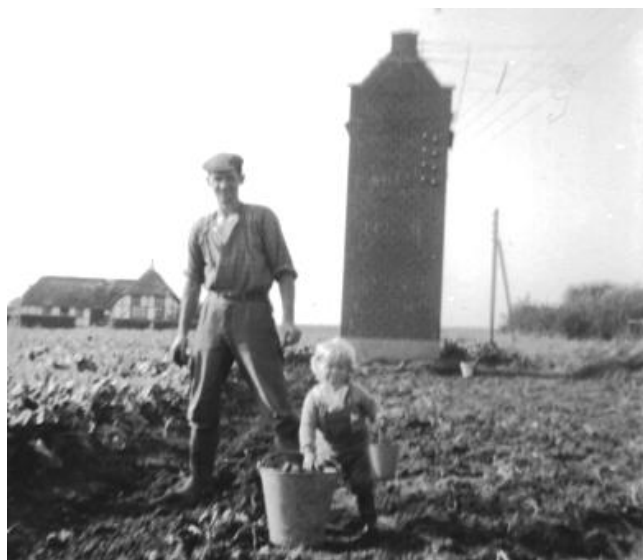
Optagning af kartofler ved Husoddevej, ca. 1962. Bemærk den nu nedlagte transformerstation.