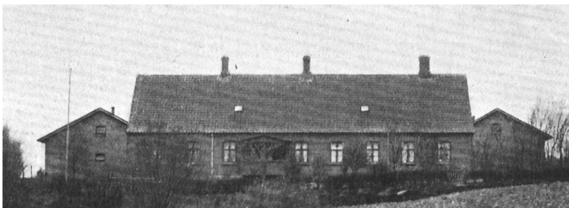
Amballegaard på Værvej, 1910.