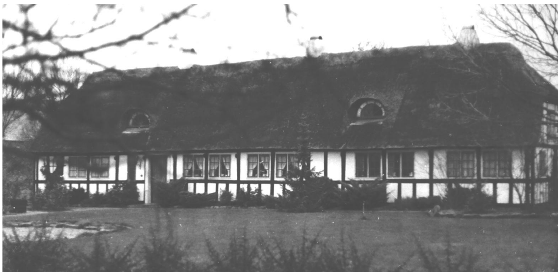
Stuehuset efter restaureringen. Foto 1970'erne.