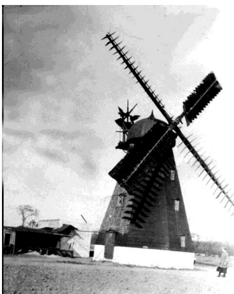
Møllen på Tværvej, ca. 1920.

Stensballe Mølle med 1 tdr. land lå på den nordvestlige side af Tværvej op mod Fortevej. Tværvej hed dengang Møllegade. Møllen var af typen "hollænder", og den regnes bygget i sidste halvdel af 1800-tallet. Møllen indstillede sin drift i 1942. I dag findes der kun få spor af møllen.