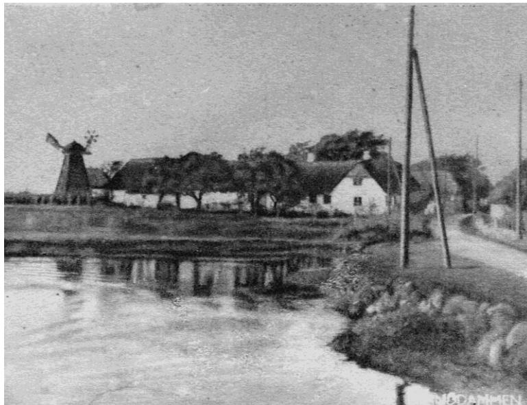
Møllen set fra branddammen på Agervej, ca. 1930.

Ud fra nævnte faktorer var valget let. Stensballe fik sin egen mølle.