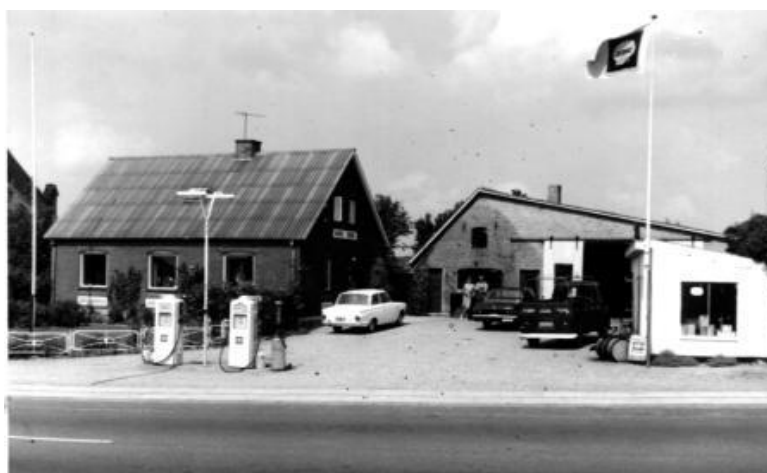
Som forretningen så ud i 1971.