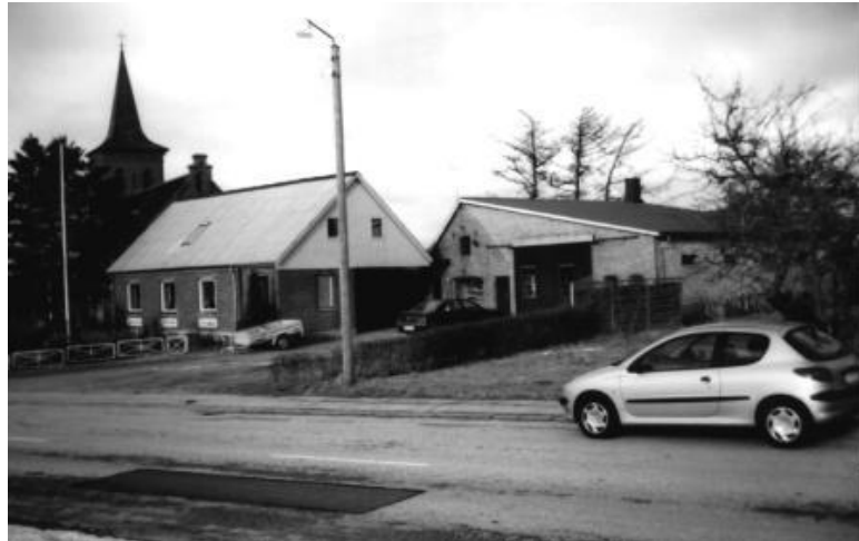
I dag er der privatbolig på Serridslevvej 17, 2006.