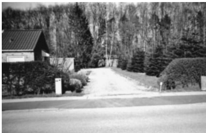
Indkørsel til vandværket, Stensballe Strandvej 39, 2005.