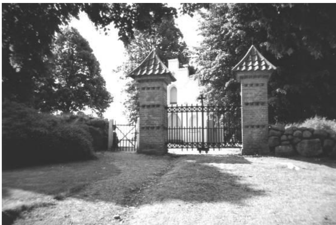
Indgangsparti til Nebel kirkegård. Foto 2008.

Kører man mod Serridslev over Vær og drejer til venstre ved vejskiltet "Nebel 2" ad Nordre Strandvej, kommer man til Nebel. Midt i byen mod syd ligger den gamle Nebel kirkegård. Indgangen er markeret af to murstenssøjler med en dobbelt gitterport af smedejern, og kirkegården er omkranset af et stateligt stendige.