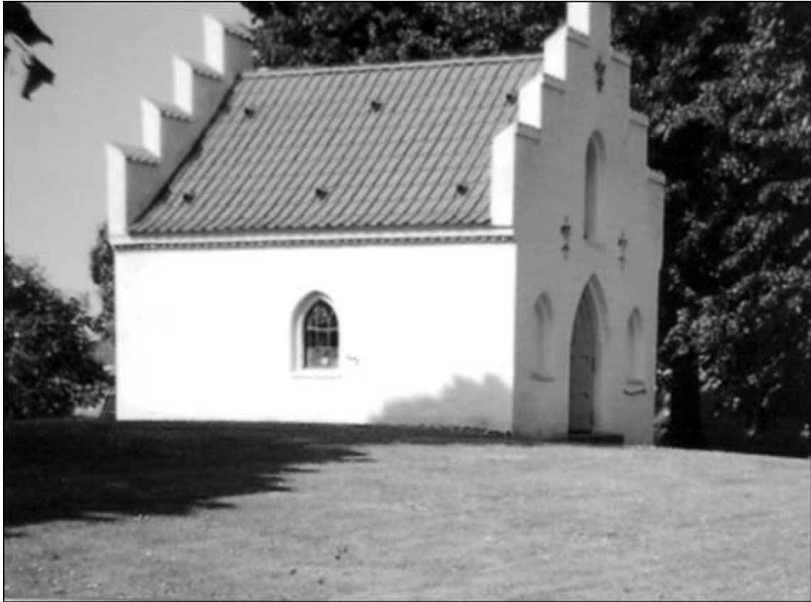
Kapellet, der i dag benyttes til opbevaring af graverens redskaber. Foto 2008.

Går man rundt på kirkegården lægger man mærke til 7 gravminder i støbejern, hvoraf det ældste er fra 1833 og det yngste fra 1861. Udover navn, fødsels- og dødsår rummer flere af dem tankevækkende inskriptioner. Et eksempel herpå: ”Hans Død begrædes af hans sørgende Enke, 5 Børn og hans gamle Forældre”. Den afdøde blev 32 år.