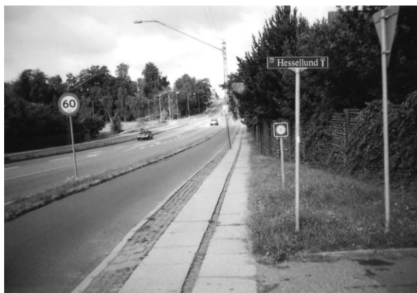
Engang var der et teglværk her. I dag er kun navnet tilbage. Foto 2009.

Grundlaget for at drive et teglværk på dette sted var forekomsten af ler i morænebankerne, som den sidste istids gletschere havde efterladt her og lidt nordpå samt på den anden side af Sundet. Det sidste ler, som det var lønsomt at bortgrave ved Hessellund, slap op omkring 1906, hvorefter man måtte lave en kontrakt med Horsens kommune og grave videre i lerforekomsten nedenfor Sønder Lindskov, dvs. foran bygningerne ved professionshøjskolen VIA. Indtil slutningen af 1940'erne var her en træbro, der førte tipvogne lastet med ler fra skrænterne over Sundet til teglværket.