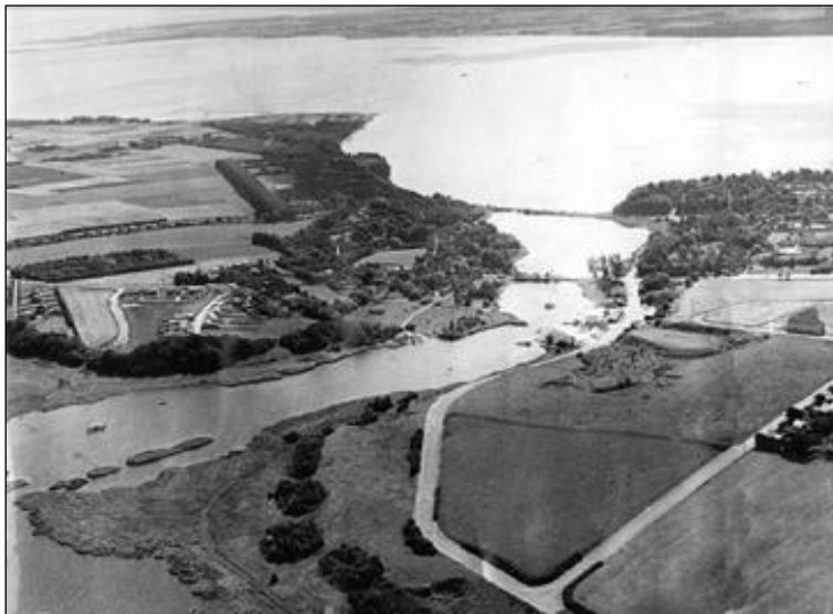
Luftfoto over Hessellund teglværk og Sundet, ca. 1905. Der var ikke bygget meget af det vestlige Stensballe på dette tidspunkt.