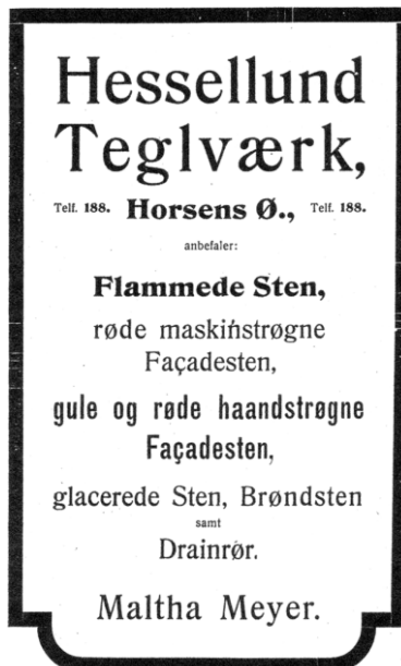
Announce fra Hessellund teglværk i Horsens Vejviser 1909.