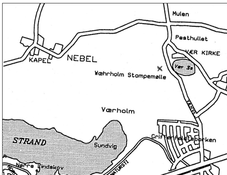
Stampemøllens placering vest for Vær sø.