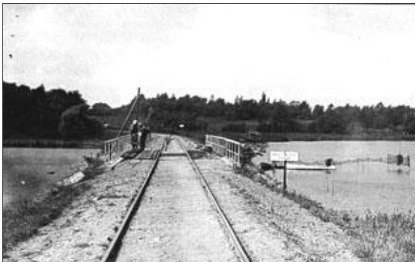
Jernbanebroen over Stensballesund fotograferet den 29. august 1943.