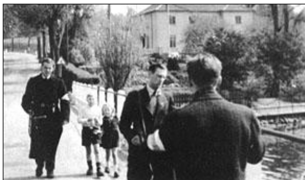
Modstandsfolk ved Sundbroen, maj 1945.

Stykket, der var i 5 akter, omhandlede sabotage, nedkastning af våben, fraternisering med tyske officerer (SS), rationeringsmærker (stor vareknaphed), sort salg (ulovligt), sladder, kærlighed, arv, samt pengeombygning efter krigen, hvor ikke skatteopgivne penge måtte betales med store bøder. Til sidst i stykket en uventet slutning (et ukendt testamente). Manuskriptet findes opbevaret på Lokalarkivet.