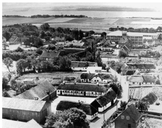
Luftbillede over Agervej, ca. 1955. Det ses, at der mellem Agervej og Bygaden (tv) var åbne arealer, flere af disse var vore legepladser.

Lokalarkivet har bedt mig fortælle lidt om min drengetid i Stensballe, 1945-1956, en tid, jeg stadig husker med glæde.