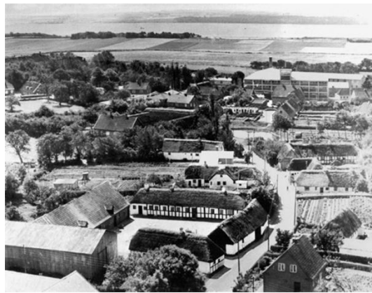
Luftbillede over Agervej, ca. 1955. Det ses, at der mellem Agervej og Bygaden (tv) var åbne arealer, flere af disse var vore legepladser.

Lokalarkivet har bedt mig fortælle lidt om min drengetid i Stensballe, 1945-1956, en tid, jeg stadig husker med glæde.