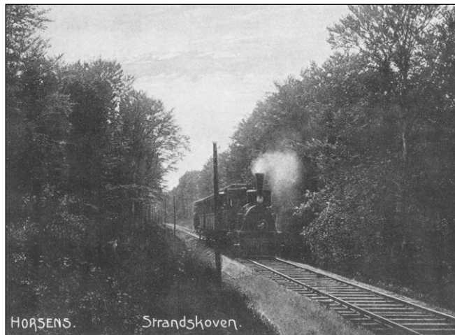
I 1945 kørte man med damplokomotiver på Odderbanen.