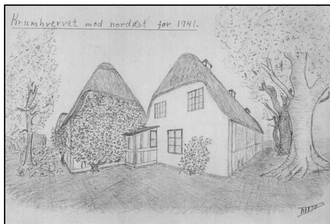
Krumhvervet mod nordøst før 1941.