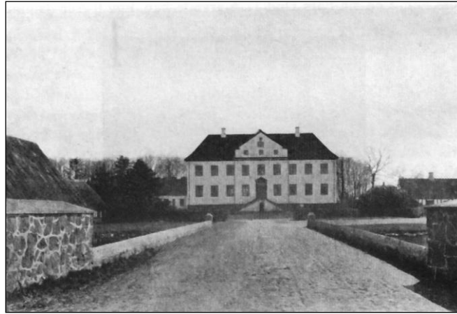
Stensballegaard uden sidefløje, 1928. (Fotografi af Hugo Matthiesen).

Kammerherren var noget af en særling. Han var stor og svær. Til daglig gik han i gul vest med hvid ryg, fløjlsbenklæder, hvide strømper og sko. Når han vandede stude, trak han en gammel kittel på. I denne dragt færdedes han overalt på godset, altid med en svær stok i hånden.